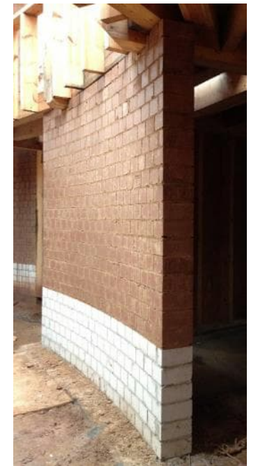
© CLAYTEC und ZRS Ingenieure, Christof Ziegert